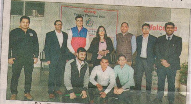
जीजेयू कैंपस प्लेसमेंट में चयनित स्टूडेंट के साथ जीजेयू शिक्षक।